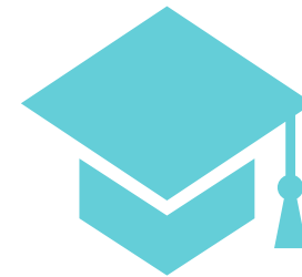
Sinh Viên Nước Ngoài