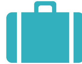
Nhà Đầu Tư