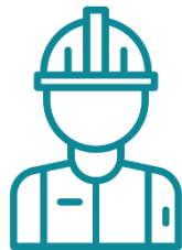
Lao động tay nghề cao